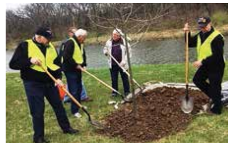
Zhora: Každoročný beh organizovaný klubom je populárnou udalosťou pre celú komunitu; členovia klubu sadia stromy v Ironwoods Park

si členov, ktorí inak zvažovali odchod, hovorí Udell. „Nie je to iba nástroj na pritiahnutie nových, ale aj udržanie si pôvodných členov.“