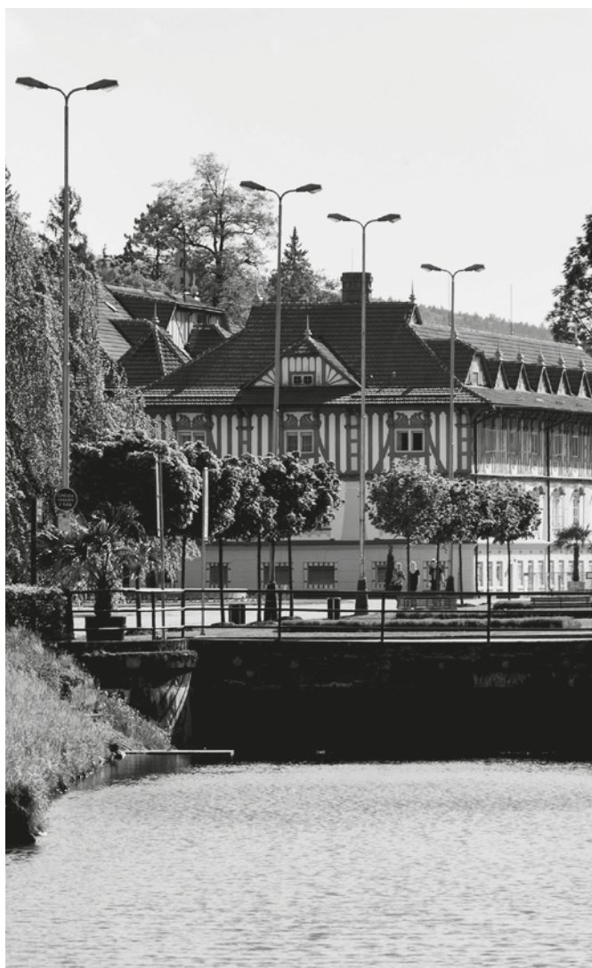
Zleva: Klubová vlaječka RC Luhačovice z archivu Libora Ferdy (RC Jihlava); Rotary kluby v oblasti Slovácka v období 1947/1948; Také lázně Luhačovice mají rotariánskou tradici