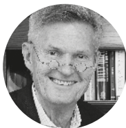
HOLGER KNAACK, PRESIDENT RI 2020–2021