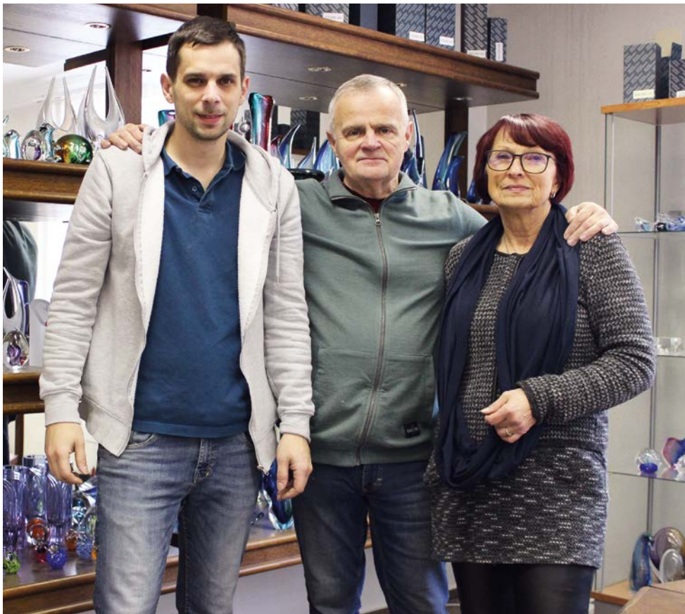
Manželka i syn jsou mu oporou