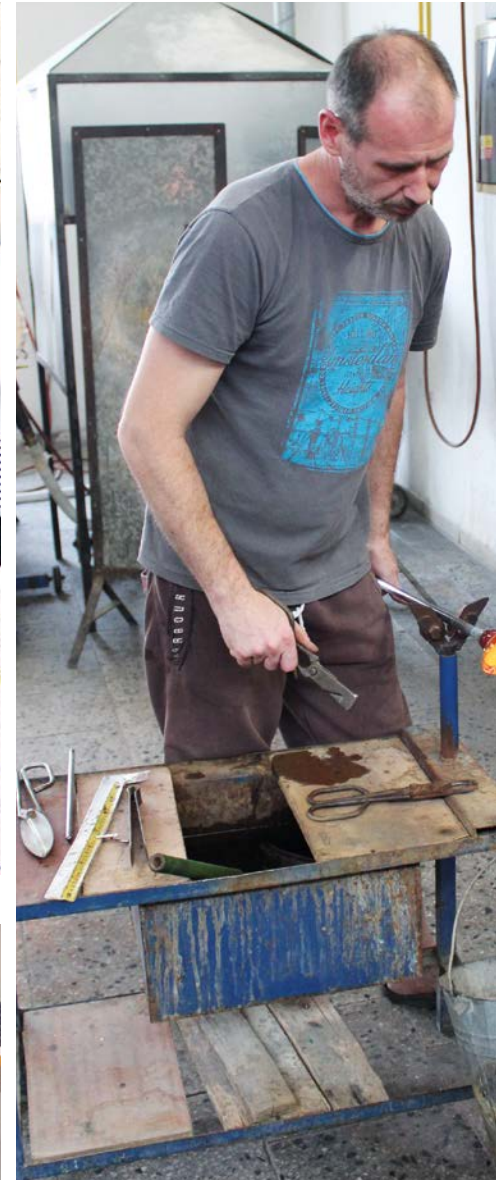
Výrobky nejen navrhuje, ale i pomáhá tvořit