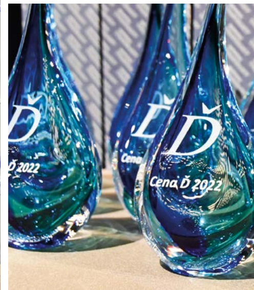
Cena Ď je srdeční záležitostí