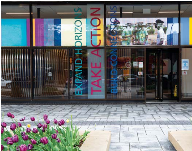
Vzhled nové budovy přitahuje pozornost a inspirovuje návštěvníky.

Nově upravená vstupní hala (na hlavní fotografii je vidět napravo) je navržena tak, aby přitahovala kolemjdoucí a zvala je k aktivnějšímu zapojení do života místní komunity. „Naším cílem je inspirovat návštěvníky,“ říká generální tajemník Rotary John Hewko. „Mnoho lidí zná budovu Rotary, ale někteří opravdu nechápou, co Rotary je a co dělá.“