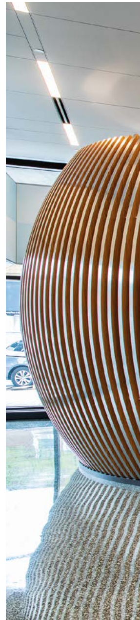
Výstava na 17. poschodí ukazuje, jak Nadace Rotary pomáhá naší síti přeměnit nápady ve skutečné aktivity. Digitální displeje poskytují aktuální informace o statistikách výskytu dětské obrny, a také představují naše partnery, sponzory a některé z významných filantropů podporujících Nadaci.