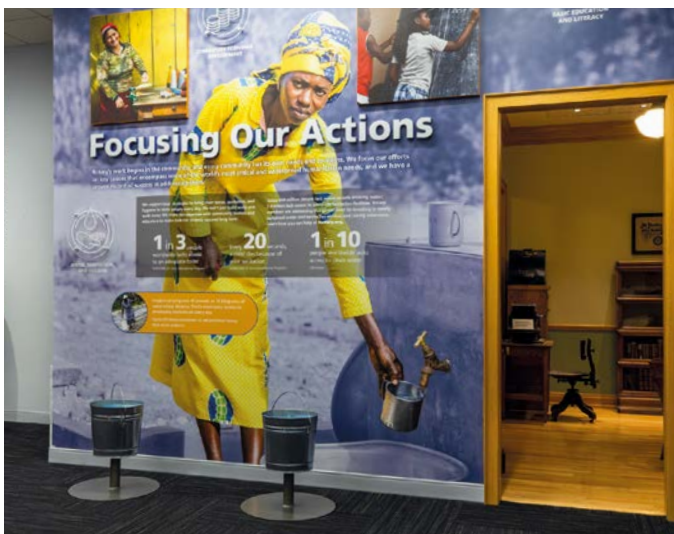
Výstavní prostor na prvním poschodí přibližuje počátky Rotary, jak se postupně vyvíjely představy o poslání Rotary, kdo jej vedl a čemu se věnovalo. V části "Zaměření našich aktivit" si návštěvníci mohou interaktivně vyzkoušet, jaké to je, když je třeba zvedat těžké kbelíky a nosit v nich vodu na dlouhé vzdálenosti.