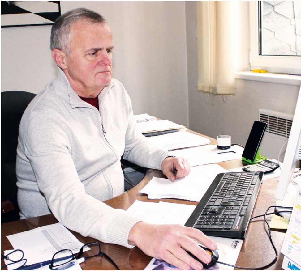
Bez ekonomických znalostí to nejde