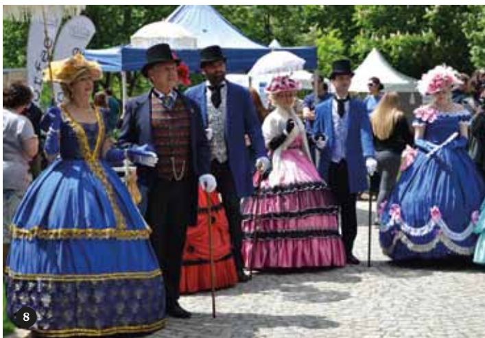
7 Návštěva z televizního Děčka 8 Spolek panstva na Žofíně