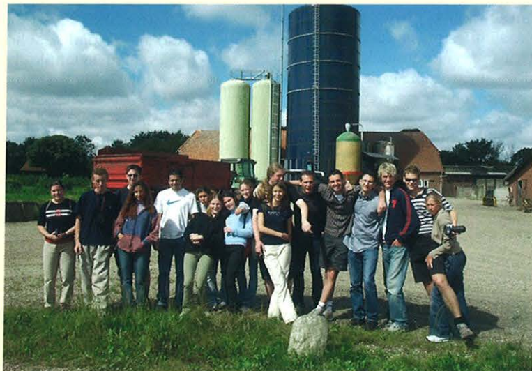
Účastníci letního tábora v Dánsku 2002 navštívili místní farmu