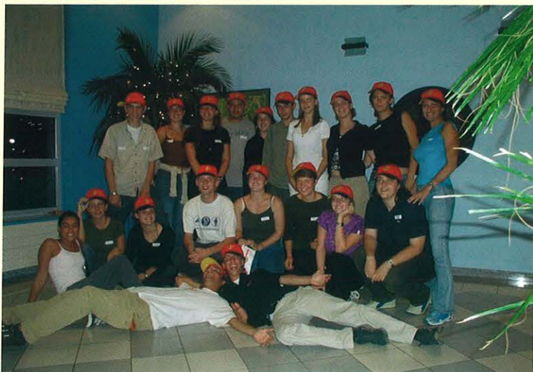
Na tábore v Belgii v létě 2002 dostali všichni účastníci pěkné čepice

Každý účastník si sám zajišťuje dopravu do místa konání tábora a zpět. Jeho povinností je pojistit se a samozřejmě dbát dalších případných pokynů organizátorů,