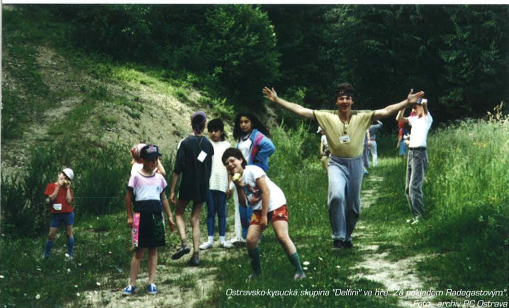
Ostravsko-kysucká skupina „Delfín“ ve hře „Za pokladem Radegastovým“