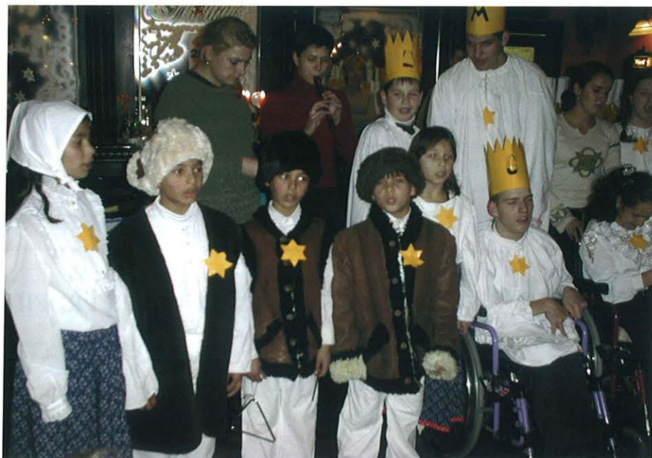
Vystúpenie žiakov Špeciálnej základnej školy J. Rumana, ktorí od liptovskomikulášskych rotariánov dostali 14 tisíc korún - výťažok z predaja vianočného punču.

Prostredníctvom RC Liptovský Mikuláš sa počas tohto rotariánskeho roka zúčastňujú dvaja študenti z Liptovského Mikuláša na dlhodobom študijnom pobyte v Spojených štátoch amerických - na Floride a v Oregone. Spoznávajú tam nielen každodenný život v rodinách rotariánov, u ktorých sú ubytovaní, ale tiež študujú na stredných školách a zdokonaľujú sa v cudzom jazyku. „Veľmi ma teší skutočnosť, že liptovskomikulášsky Rotary klub prvýkrát vo svojej histórii sprostredkoval dlhodobý študijný pobyt študentov zo zahraničia. V auguste minulého roka do Liptovského Mikuláša pricesto-