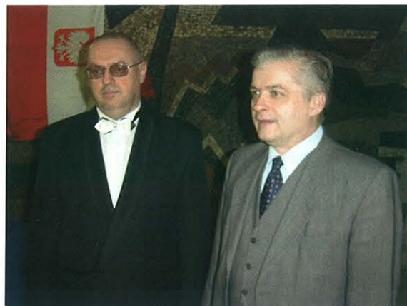
Novovymenovaný honorárny konzul Tadeusz Frackowiak (vľavo) spolu s Włodzimierzom Cimosiewiczom, ministrom zahraničných vecí Poľskej republiky.