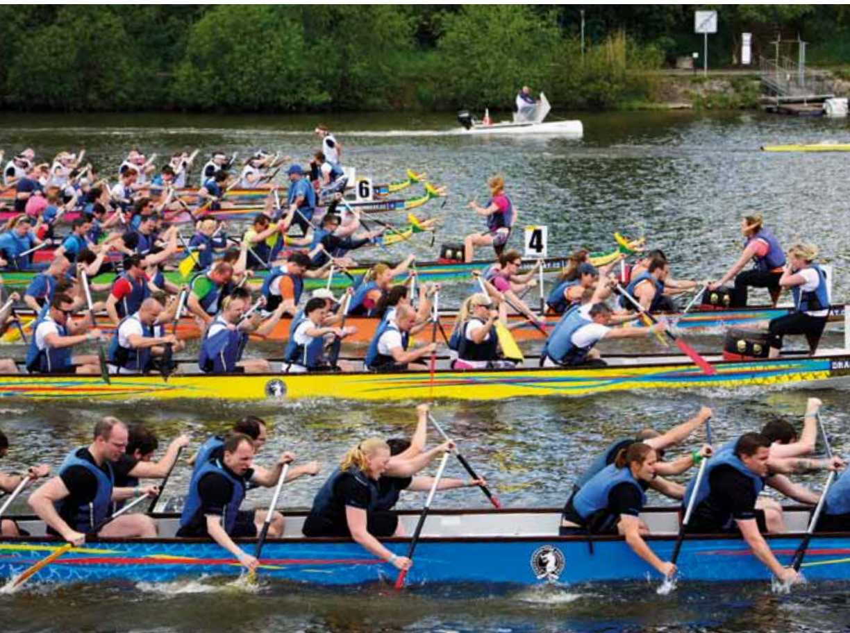
Sobotní závod se konal opět ve Žlutých lázních v Podolí, tentokrát v rámci oslav 20. výročí vzniku Asociace dračích lodí.