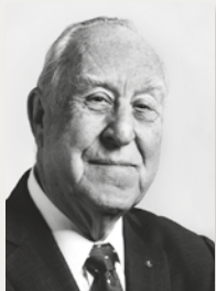
JOHN F. GERMA Prezident Rotary International

ČERVENEC 2016 Dnes vstupujeme do rotariánského roku, který jednou může být označen jako nejvýznamnější v naší historii: rok, během kterého zaznamenáme poslední případ výskytu dětské obrny. Divoký virus polio způsobil v roce 2015 již jen 74 případů obrny a všechny přitom v Afghánistánu a Pákistánu. A ač budeme neúnavně pokračovat v úsilí dosáhnout našeho cíle – úplného vymýcení dětské obrny, musíme se již podívat za horizont tohoto cíle: připravit se na to, jak svůj úspěch přeměnit na ještě větší úspěchy v budoucnu.