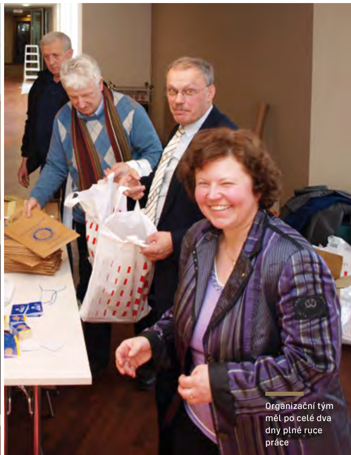
Organizační tým měl po celé dva dny plné ruce práce