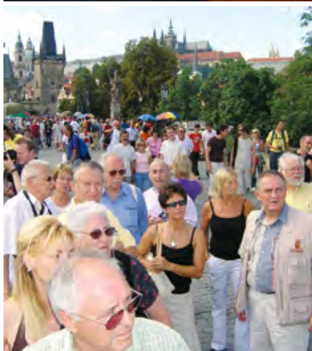
V srpnu 2006 se v Plzni a Praze uskutečnilo pracovní setkání zástupců patnácti evropských redakcí regionálních časopisů Rotary