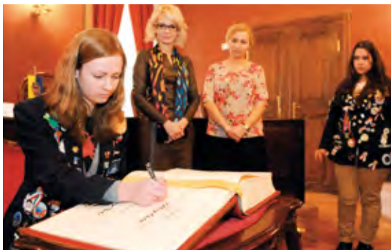
TEXT: Z tlačovej správy TASR spracovala Jozefa Poláková, PDG