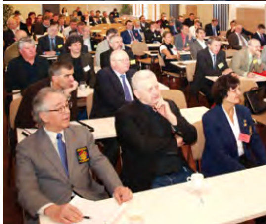
Kongresový sál hotelu Maximus Resort byl zaplněný po oba dny