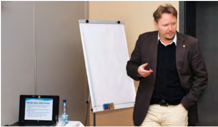
WRITTEN BY: Stanislav Srnka