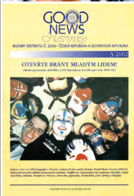
První čtyři roky vycházel časopis v této grafické úpravě