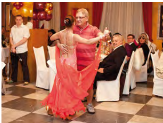
Súčasný prezident v maske „golfistu“ zahájil ples prvým tancom

Více fotografií z uveřejněných akcí najdete v elektronické verzi časopisu na www.rotarygoodnews.cz