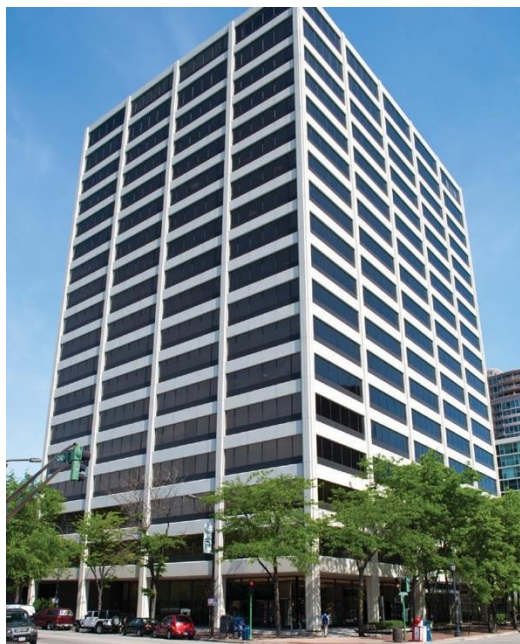
Budova One Rotary Center v Evanstonu, stát Illinois, USA

Rotary International je spravováno Sekretariátem, který je tvořen generálním sekretářem a v němž je téměř 800 zaměstnanců, kteří se věnují podpoře klubů a distriktů na celosvětové úrovni. Světové ústředí Rotary sídlí v Evanstonu, Illinois, USA, v budově zvané One Rotary Center. V ní je k dispozici auditorium pro 190 sedících, archiv Rotary. Celé jedno křídlo budovy užívá exekutiva RI. Jsou tam konferenční místnosti sloužící členům Rady ředitelů RI a členům Správní rady Nadace Rotary a také kanceláře Prezidenta RI a dalších vysokých činníků.