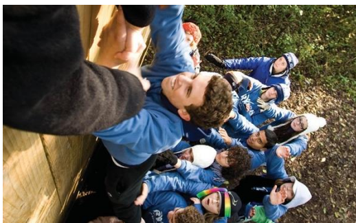
Semináře RYLA učí hodnotám služby a schopnosti vést již od raného věku

Interact a Rotaract kluby jsou podporovány Rotary kluby z blízkého okolí. Zeptejte se činovníků vašeho klubu, jak se můžete zapojit, kdybyste chtěli pracovat s místním Interact nebo Rotaract klubem.