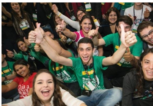
Rotaract members meet yearly before the convention.

Věříme tomu, že investicí do naší budoucnosti je posilování schopností vest jiné u mladých lidí tím, že jim umožníme nabýt potřebných schopností a získávat zkušenosti napříč kulturami.