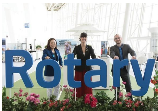
Účastníci kongresu Rotary International roku 2016 konaného v Koreji